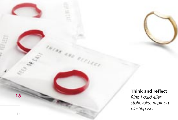
Think and reflect Ring i guld eller støbevoxs, papir og plastikposer