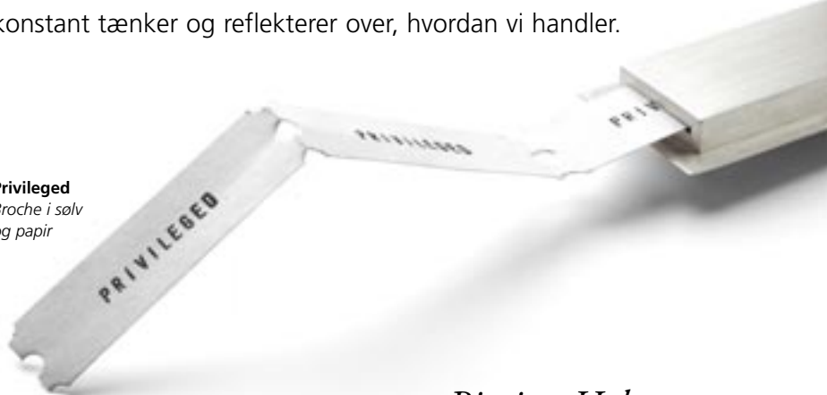
Privileged Broche i sølv og papir

Hendes smykker sætter fokus på, hvordan vi opfører os over for hinanden – involverer os eller distancerer os – og udspringer af hendes indignation og nysgerrighed og med krav om, at vi konstant tænker og reflekterer over, hvordan vi handler.